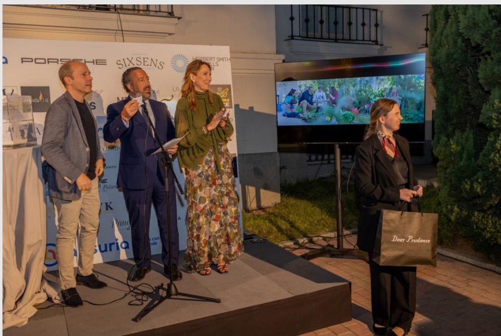
Voluntaria esperando entregar el regalo de Dear Prudence