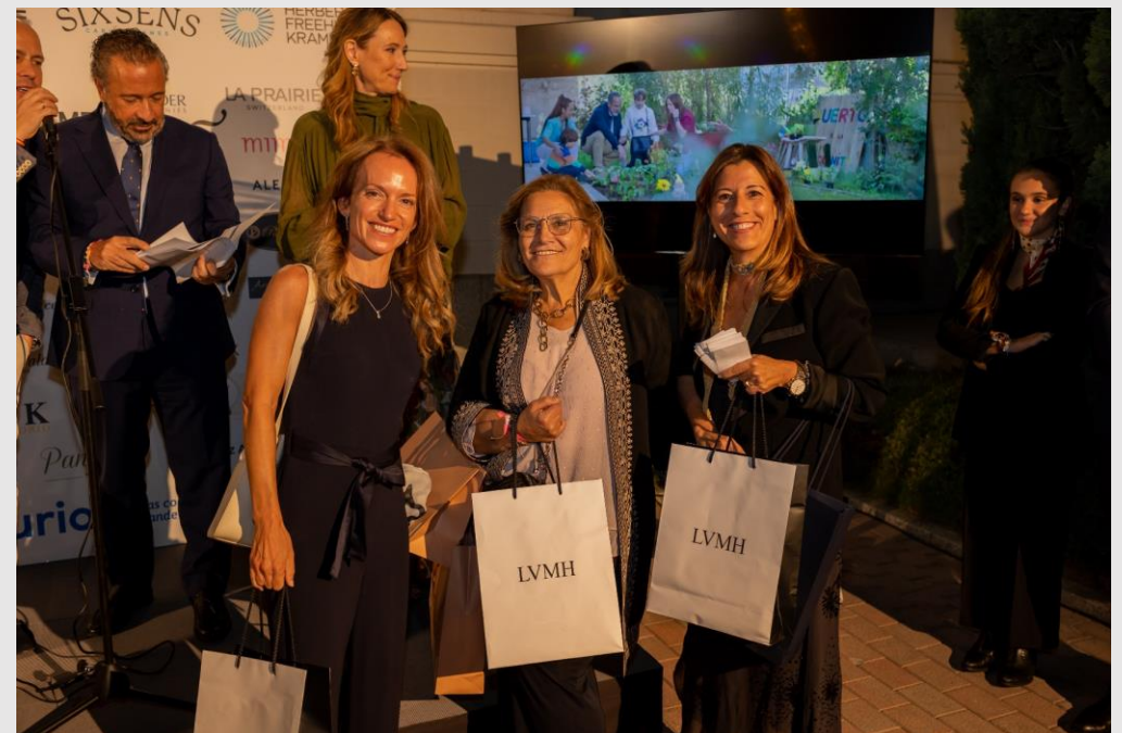
Tres agradecidas con regalos de LVMH