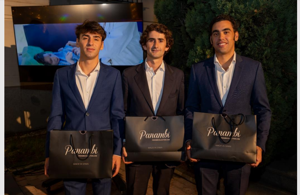
Voluntarios dispuestos a entregar los regalos de Panambi