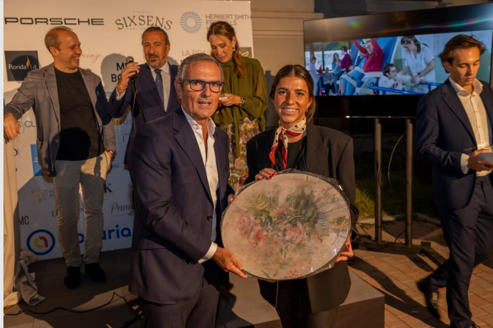
Un premiado con la obra de Gloria Loizaga