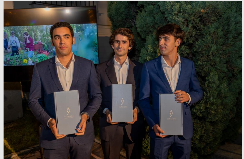
Voluntarios con los regalos donados por Alonso del Yerro