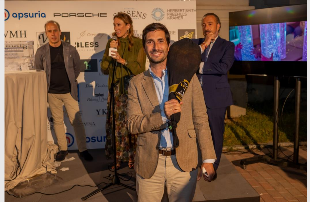
¡Un jamón es un delicioso regalo!