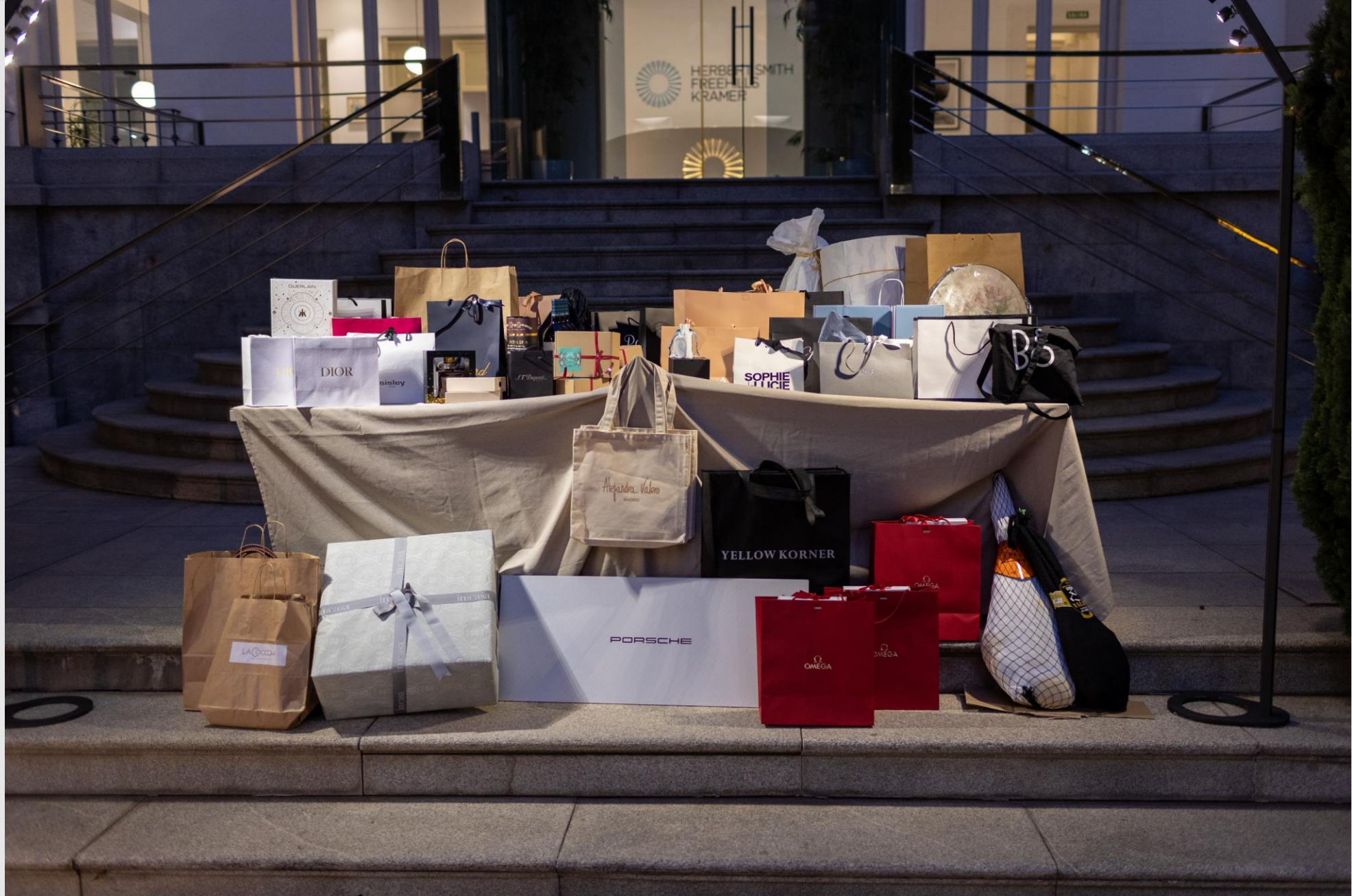
“Los asistentes que participaron en la Rifa Solidaria, optaron a más de 100 regalos, donados por las marcas”.