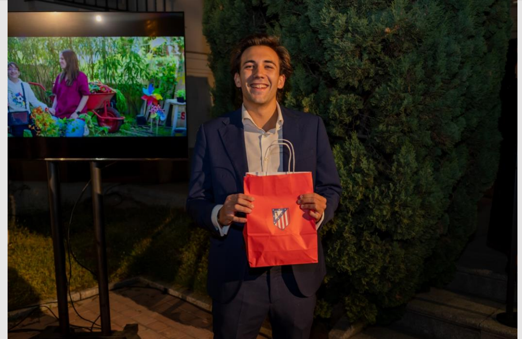
Voluntarios y Premiados