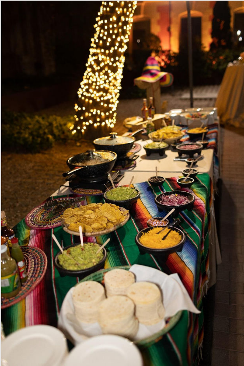
¡Los tacos de Sixsens no pasaron inadvertidos!