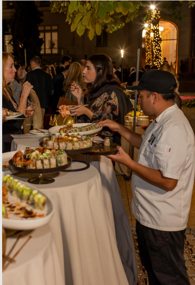
¡Stand de Sushi, cedido Salvaje Madrid!