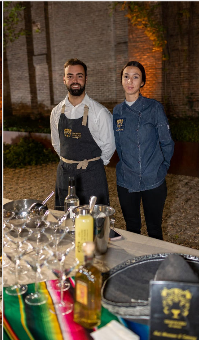
Tequilero by Hoos y su tequila