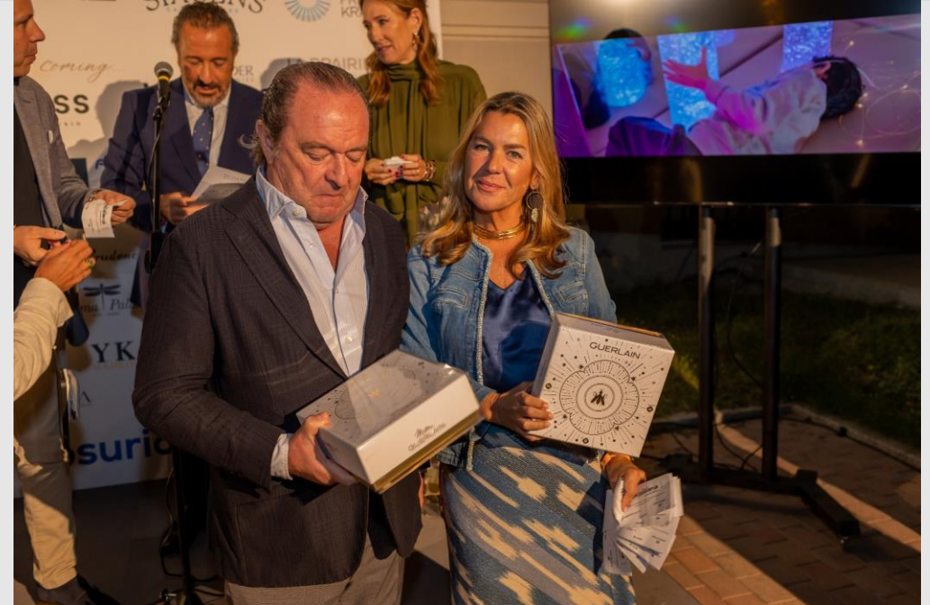
Dos cajas de Guerlain para esta pareja